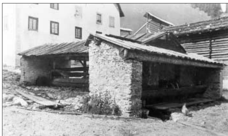
Questa construcziun davant ina chasa a Sedrun dal 1910 na para ad emprima vista gnanc in bigl, ma i sa tracta da dus bigls cuverts, colliads in cun tschel.