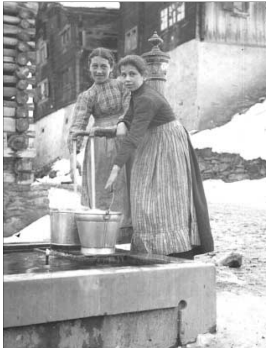
A Vrin dal 1912. Quest bigl para dad esser pli nov, el è da cement e la pitga è da fier. Quest model datt' igl er en Engiadina (sutvart).