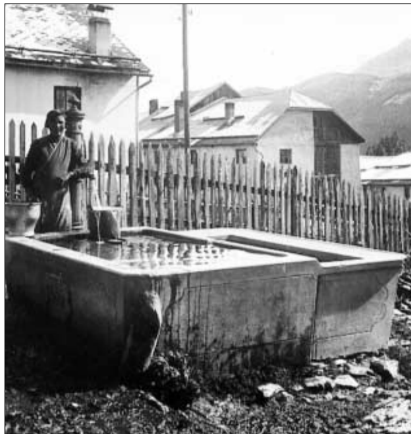
Bigl da cement a Tschlin, cun la tipica partiziun en dus: il bigl grond sura per bavar e quel pitschen, pli bass giu, per lavar.