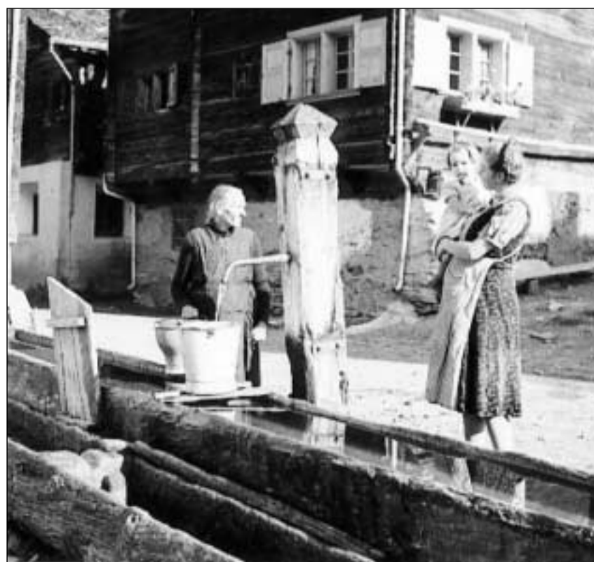
Simpel bigl da lain a Duin.