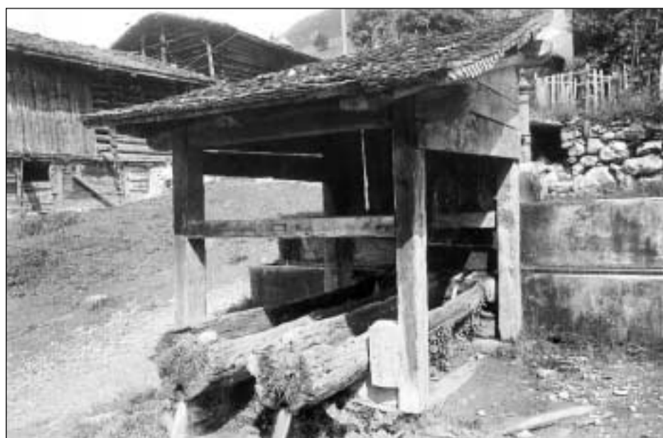
Bigl cuvert a Sumvitg. Ins vesa in toc dal bigl sura per bavar, da cement; quel sut per lavar è fatg mo or da dus gronds lains chavads or. El nun ha nagin stapun, uschia che l'aua curra libramai vinavant.